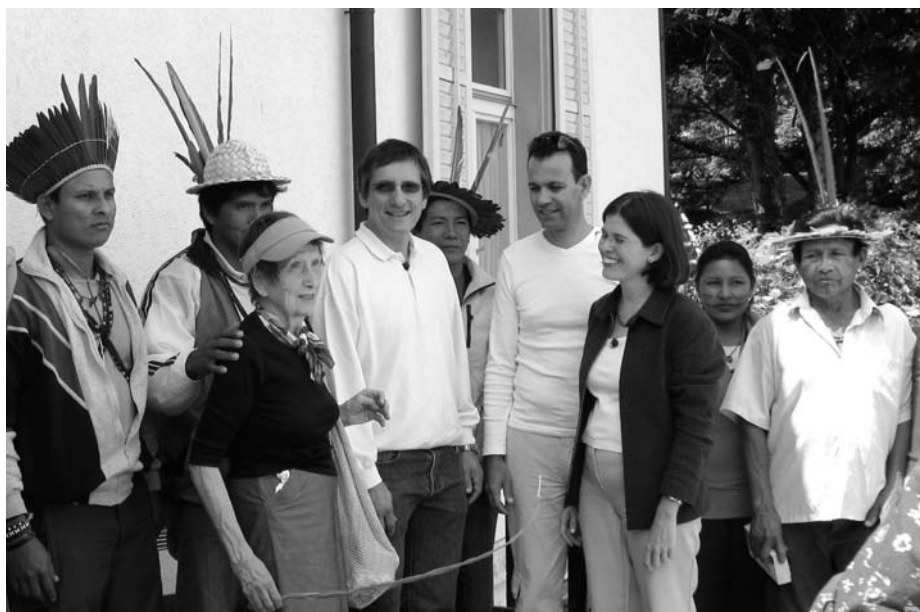
Familientreffen in Basel 2009

telte, daß es realisierbar sein würde. Nach seinen Erfahrungen war bei einer Reisegruppe von fünf bis sechs Personen mit Projektkosten von etwa 30.000 Euro zu rechnen. Die Aufgabe war also, mindestens drei bis vier Museen zu finden, die gemeinsam das Projekt finanzieren, also jeweils 5.000 bis 10.000 Euro beitragen würden. Schnell war klar, daß Museen nur dann Geld in dieser Höhe geben können, wenn sie einen Gegenwert erhalten. Daraus entstand der Gedanke, daß die Besucher jeweils Sammlungen herstellen, dokumentieren und mitbringen sollten, um diese mit den Museen gegen die Reisekosten zu tauschen.