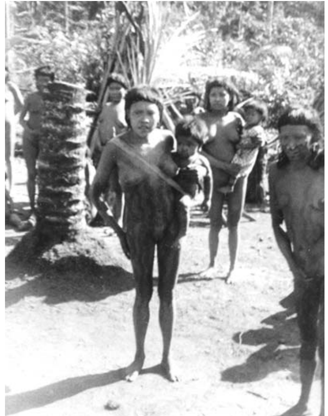
Frauen der Makurap, Heinrich E. Sneath, 1934