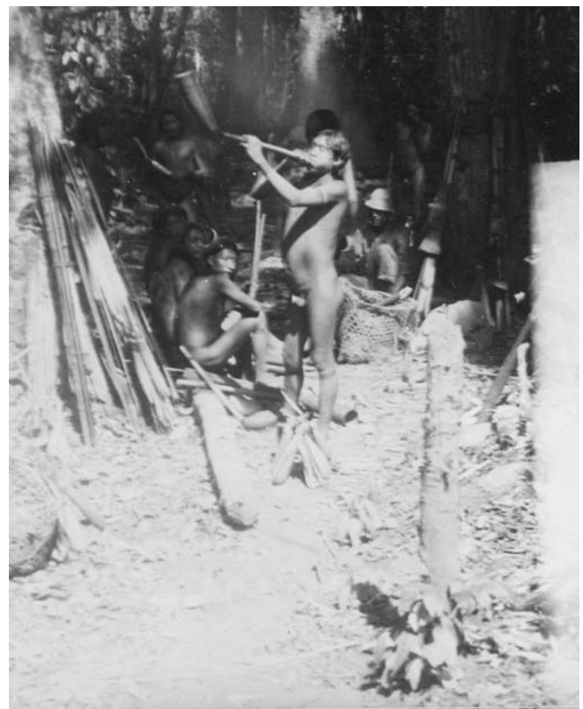
Männer der Makurap, Heinrich E. Sneath, 1934